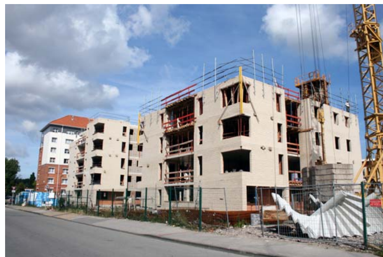
Dunkerque – Jeu de Mail Construction de logements et activités