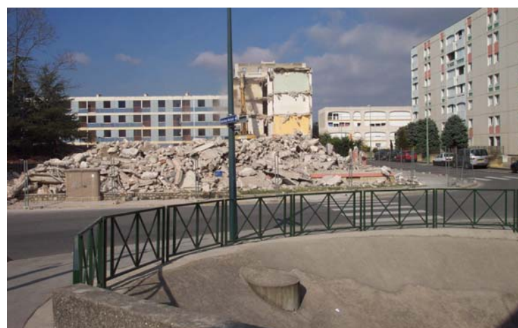
Valence Démolition de l'immeuble les Aravis