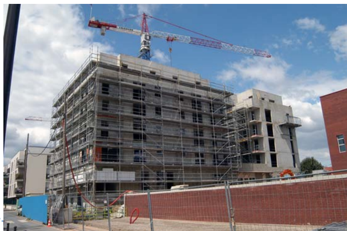
Vitry-sur-Seine - Balzac construction de logements